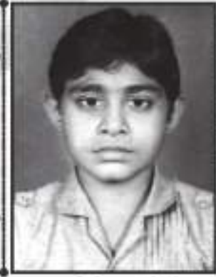
સ્વ. ચિ. અમીત વિનોદચંદ્ર વિજપાર નિસર (ખારોઈ)